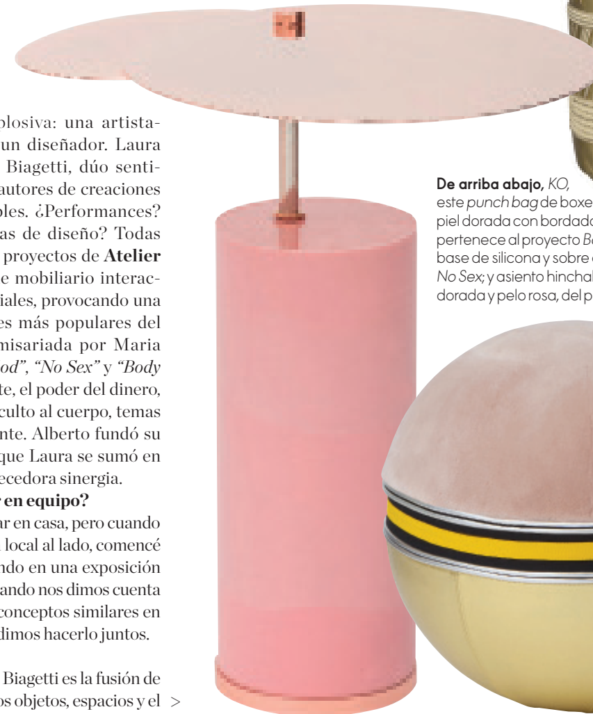
De arriba abajo, KO , este punch bag de boxeo en piel dorada con bordados en hilo de oro, pertenece al proyecto Body Building . Mesita con base de silicona y sobre de metal, de la colección No Sex ; y asiento hinchable Palla , tapizado en piel dorada y pelo rosa, del proyecto Body Building .