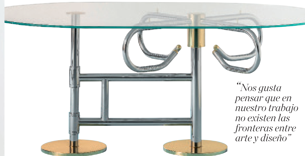
El poder del dinero es el tema de la colección GOD , de la que forma parte la mesa Tornello , en edición limitada de siete piezas.