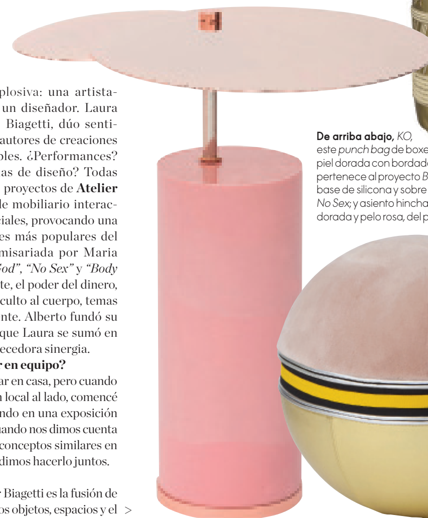
De arriba abajo, KO , este punch bag de boxeo en piel dorada con bordados en hilo de oro, pertenece al proyecto Body Building . Mesita con base de silicona y sobre de metal, de la colección No Sex ; y asiento hinchable Palla , tapizado en piel dorada y pelo rosa, del proyecto Body Building .