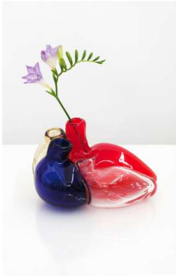
L'uomo di vetro, 2008. Vaso in vetro per Venini. Nella pagina a fianco, Eroe, 1999. Tavolo di legno laccato, 80 x 140 x 110 cm

AB: La forma che può essere un'espedito, un'indizio, generare un'emozione, suggerire comportamenti. Non credo all'idea di forme perfette ma sono certo esistano equilibri che generano linguaggi affilati e inediti, scenari inattesi. Questo ha a che fare anche con la psicologia e con la nostra memoria